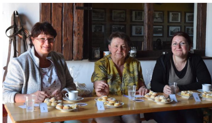
Odborná porota pečlivě hodnotila dodané vzorky.