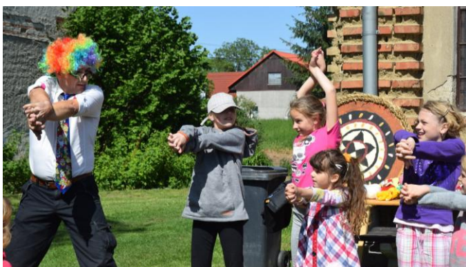
...a dobře se bavily s klaunem