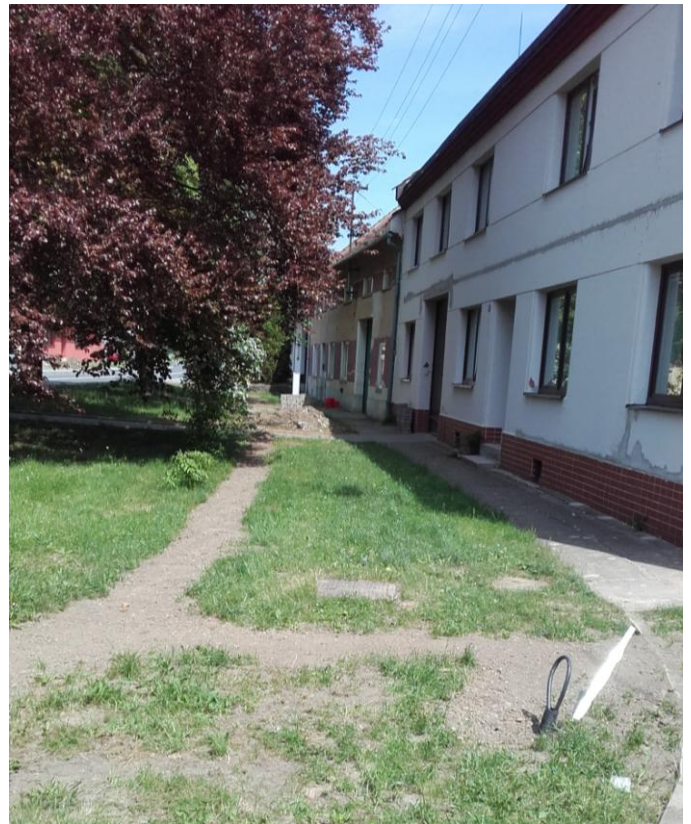
Rekonstrukce vedení nízkého napětí se pomalu chýlí k závěru.

Zastupitelstvo schválilo zpracování nové projektové dokumentace na veřejné osvětlení a realizaci vedení veřejného osvětlení. Zastupitelstvo pověřilo starostku obce podepsat smlouvu o závazku zhotovitele MSEM a.s. realizovat stavbu „Grymov – vedení veřejného osvětlení“. Zastupitelstvo schválilo na základě žádosti Ing. Grygara a paní Fialové zpracování projektové dokumentace na zhotovení veřejného osvětlení na p.č. 360 u nových rodinných domů.