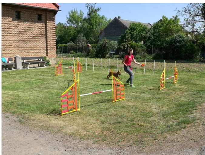
Psi předváděli agility, dogfrisbee i dogdancing