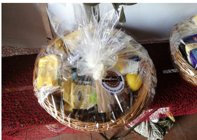
Na výherce čekala hodnotná tombola