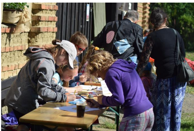
Děti soutěžily o nejkrásnější kreslený koláč...