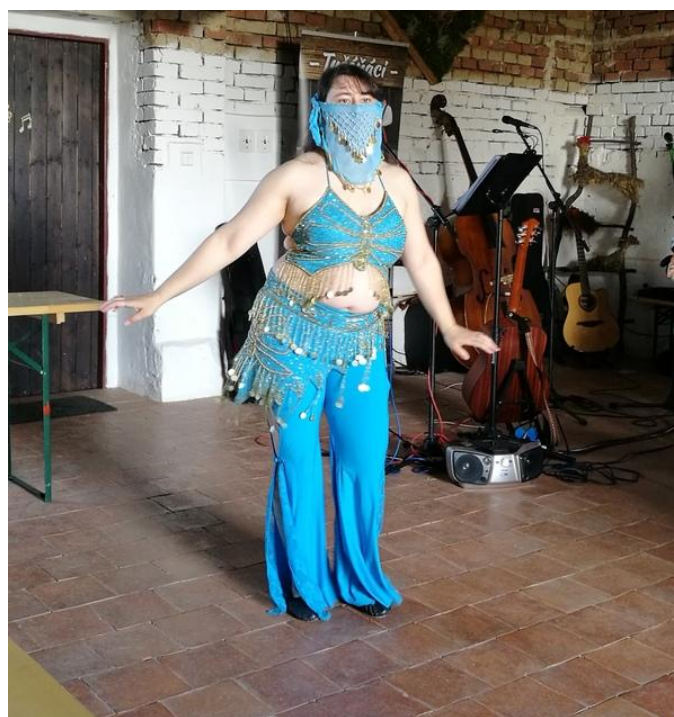
Překvapením odpoledne byly břišní tance