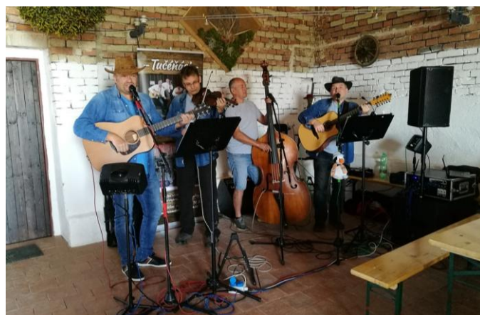
Tučěňáci hráli jako vždy skvěle