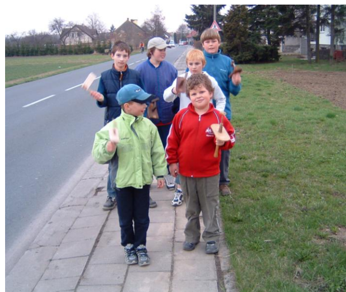
Velikonoce 2006 – poznáte je?