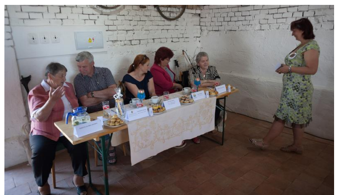
Odborná porota vybírala vítězný koláč v rámci soutěže O nejlepší koláč Pobečví.