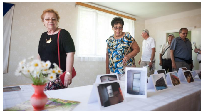
Hlavní část programu probíhala v obecní stodole a jejím okolí.