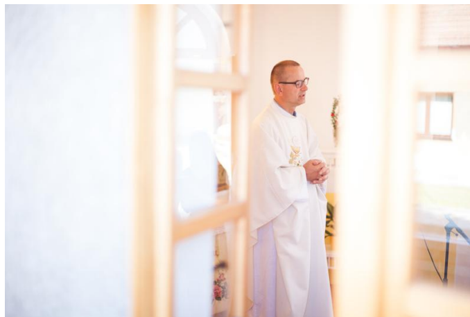
Slavnostní program zahájila mše za obec.

Dne 3. června 2017 se uskutečnilo setkání rodáků u příležitosti 230 let od založení obce spojené s prvním ročníkem soutěže O nejlepší koláč Pobečví. Děkujeme všem účastníkům i organizátorům!