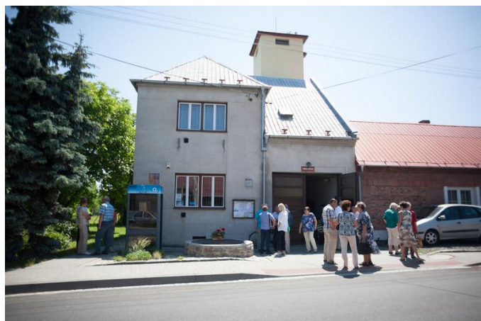
Následovala prohlídka obecního úřadu a knihovny.