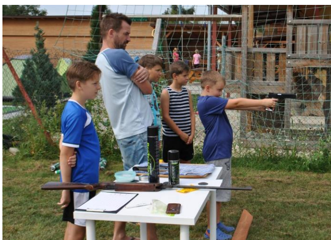
Střelba z airsoftové pistole se dětem velmi líbila.