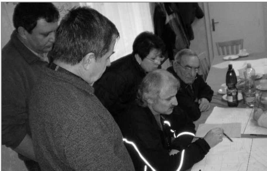
Myšlenky z plánovacího víkendu do koše určitě nespady. Jejich realizace ale závisí na zajištění financování, což jde ale pomalu.

A co zbytek návsi? Koncem února obec podala další žádost o grant. Tentokrát šlo o menší