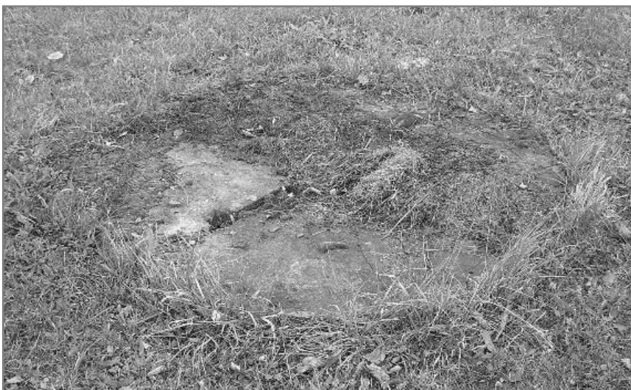
Na nepoužívanou studnu není potřeba ani povolení ani ji není nutné likvidovat.

Pokud vodu z řeky, potoka, rybníka čerpáte nějakým technickým zařízením, pro jehož provoz je třeba energie (elektrická, me-