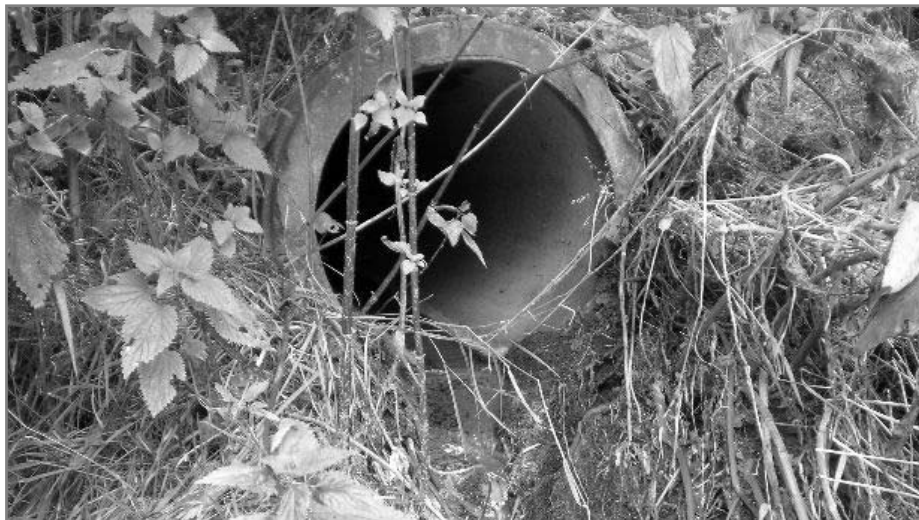
Pokud je dům napojen na obecní kanalizaci, tak žádné povolení na vypouštění odpadních vod nepotřebuje.

Zpracováno podle letáku Magistrátu města Přerova.