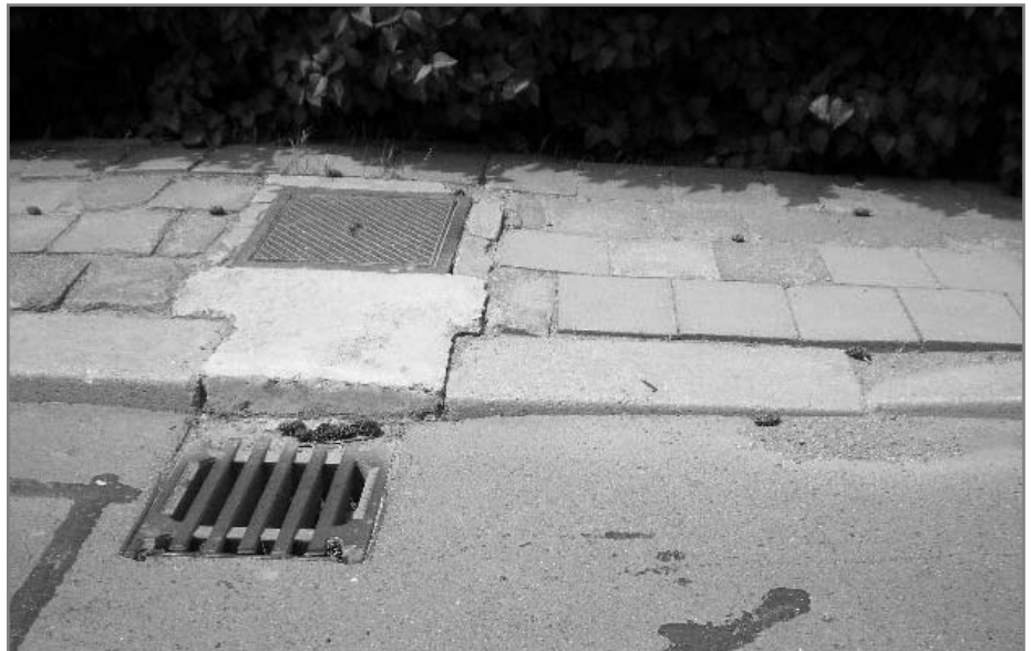
Jako první přijdou na řadu rozbité chodníky a autobusová zastávka u obchodu.

Obec tedy žádá peníze na to, aby mohla získat o více peněz, než kolik je sama schopná dát z vlastních skromných prostředků. Určitě je lepší využít svých 200 tisíc tak, že k nim stát přidá dalších 300 tisíc a pro obec