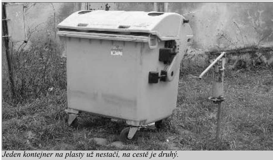
Jeden kontejner na plasty už nestačí, na cestě je druhý.