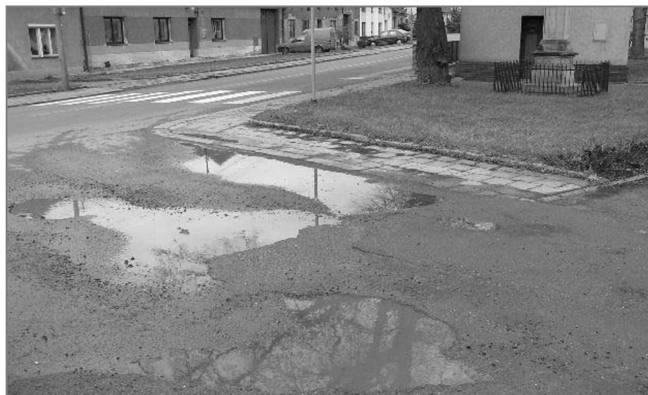
Výtluky před čekárnou i na cestě na Vrbovec by měly v dohledné době zmizet.

Zastupitelé provedli terénní šetření stavu komunikace na Vrbovec a konstatovali, že větší část nerovností vznikla v souvislosti s překopy cesty stavebníky, menší část souvisí s běžným opotřebením. Stavebníci budou vyzváni k provedení opravy v souladu se stanoviskem vydaným obcí v rámci povolování stavby ve lhůtě 3 měsíců. Druhou variantou bude možnost finančně se podílet na opravě komunikace, kterou by zajistila obec.