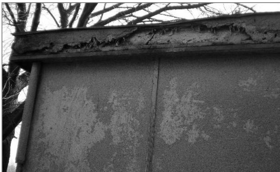
Buňka na hřišti si opravu už skutečně zasloužila....

Pan Kučera informoval o přípravách obložení obecní buňky na hřišti cementotřískovými deskami CETRIS, které provedou členové SDH Grymov a o zájmu SDH Grymov převzít sportovní areál do vlastní péče . Členové ZO proti tomu nevznesli žádné námítky.