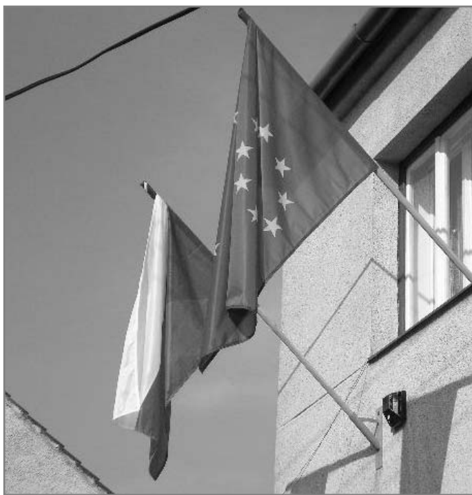
Tak jsme zase (ne)volili...

Do druhého kola postoupili Ing. Jiří Lajtoch za ČSSD a RSDr. Josef Nekl za KSČM, kteří se v obci na předních místech neumístili, což zřejmě přispělo k minimálnímu zájmu voličů. K volební urně se 4. a 5. května 2007 dosavilo jen 11 voličů ze 132 (tj. pouhých 8 %!). Těsně zvítězil kandidát KSČM, který získal 6 hlasů, kdežto kandidát ČSSD hlasů 5.